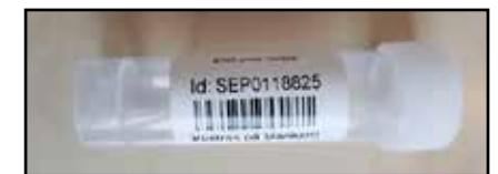
Klistra etiketten längs med provröret.