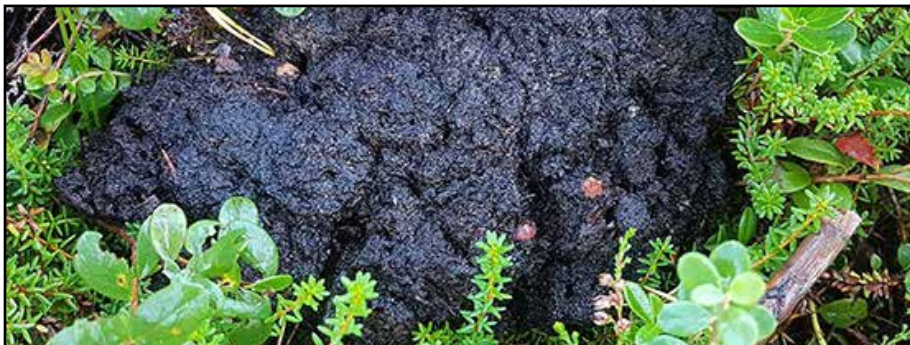
En ärtas storlek av björns spillningen räcker!