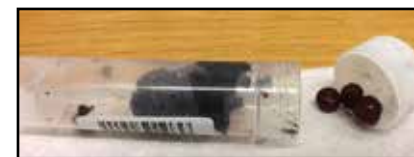
Prov av björns spillning fylld av blåbär.