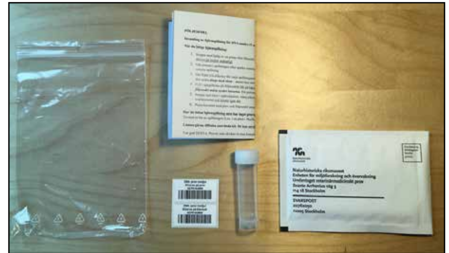
Provtagningskitet innehåller ett provrör, två klistermärken med streckkoder, tryckta instruktioner och ett frankerat kuvert.

Provtagningskit skickas ut från Naturhistoriska riksmuseet till Länsstyrelsen i det/de län som ska inventeras. Länsstyrelsen skickar dessa vidare till särskilda utlämningsställen och t.ex. jaktlag, rovviltssamordnare för samebyar och jägareförbundets rovviltansvariga i kretsarna. Lämna gärna tillbaka kit du inte använt. De kan användas i ett annat län nästa år.