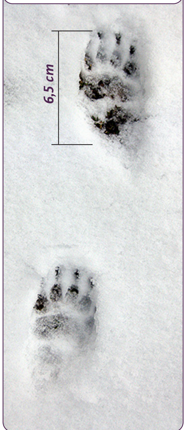
Foto av fotspår

Titta noga på bilderna och prata ihop er i gruppen när ni sätter kryss i tabellen.