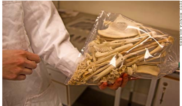
Så här lite återstår av en svart stork efter att den har skeletterats.