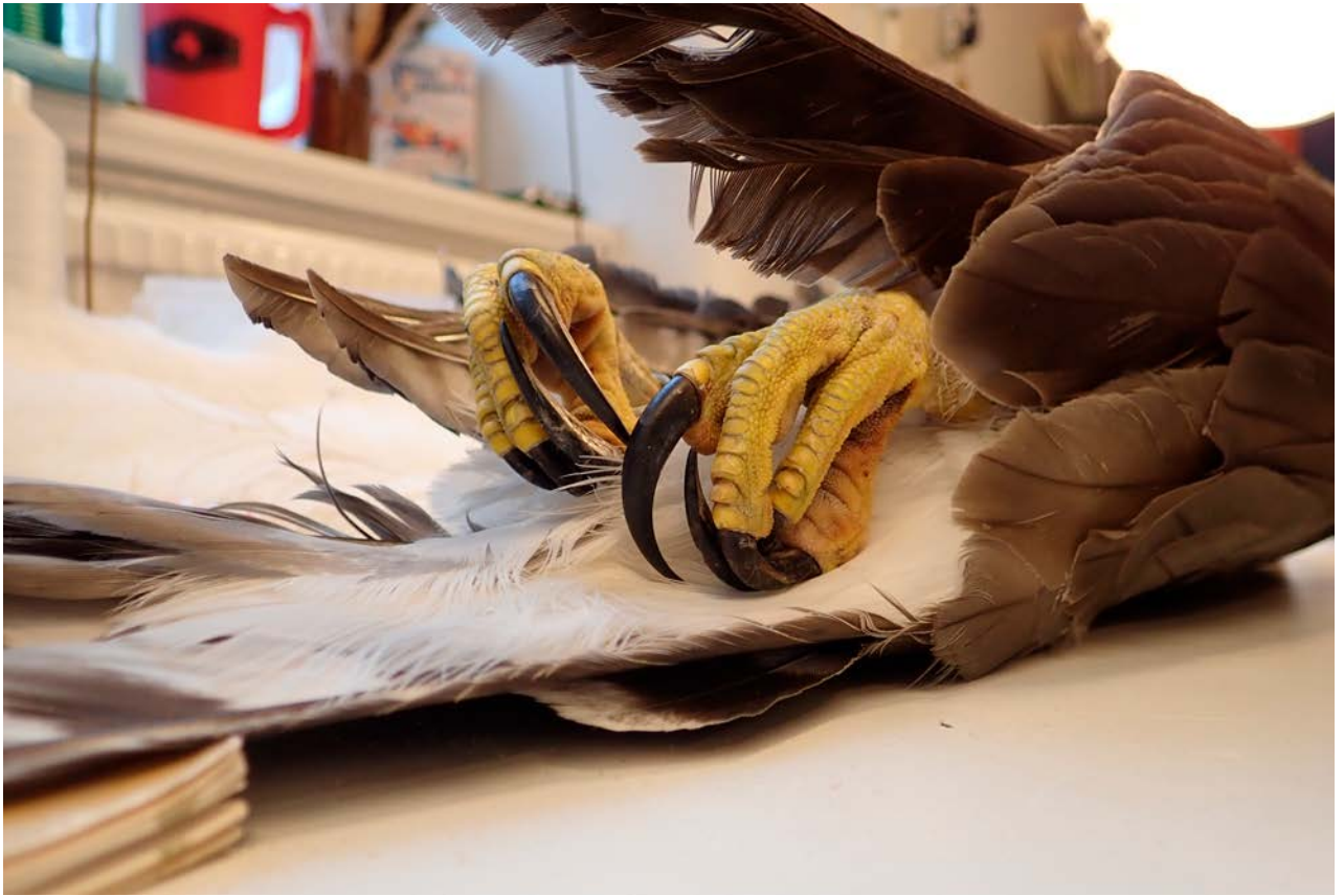
Duvhökens klor är verkligen imponerande!

så Peter klipper av leden mellan tibia och lårben efter att ha frilagt den. Det ser underligt ut när benet plötsligt hänger rakt ner mot golvet. Sedan ska stjärten frigöras och ”petmojen” kommer fram igen.