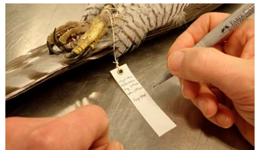
De olika mått som togs noteras för hand på etikettens baksida. Ett speciellt papper och en speciell penna används eftersom det är viktigt att etiketten håller länge.

förstörd. Sedan får de torka ytterligare en knapp månad innan de fryses i en vecka för att döda eventuella skadedjur.