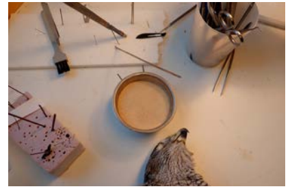
Förutom en död fågel behövs även olika verktyg och majscolvmjöl för skinnläggningen.