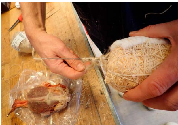
Linblånor lindas runt ena änden av ståltråden för att skapa en hals. Mannekängen är i övrigt gjord av träull, bomullsvadd och dito tråd.