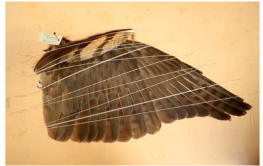
Vingen uppspänd för att torka. Berguvsfjäders skyddar de minsta fjädrarna från att rubbas av tråden. Notera att höken hade tre växande armpennor när den dog.