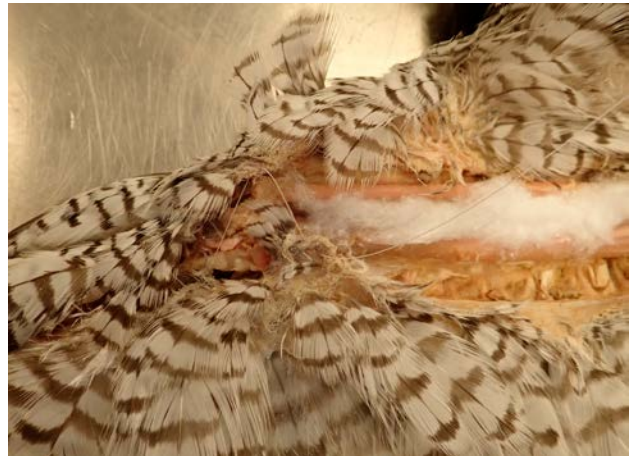
Underarmen fylls ut med bomull och skinnet sys ihop med bomullstråd.