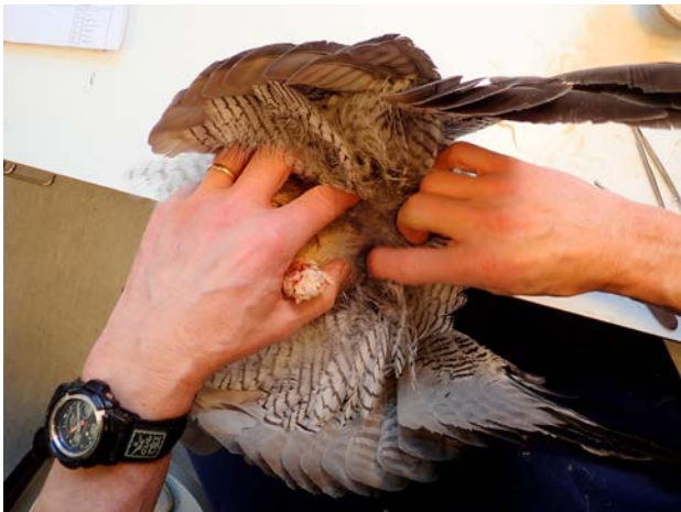
Kroppen har beströts med majscolvmjöl och skinnet flås av.