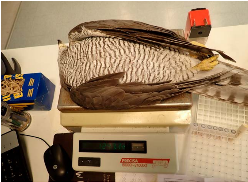
Först vägs duvhöken och vikten noteras i protokollet. Den ska sedan föras in i museets databas.