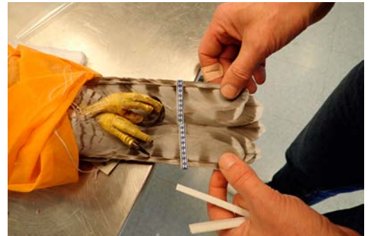
Skinnet har svepts in i tunt tyg och stjärtfjädrarna hålls på plats med påsklämmor.