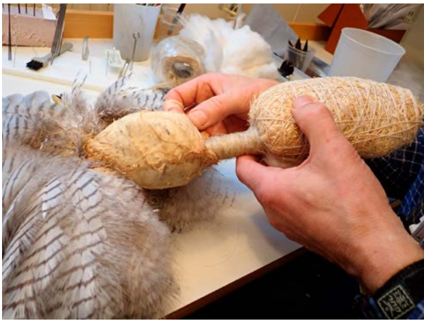
Mannekängen har fästs i kraniet och skinnet har börjat träs över.