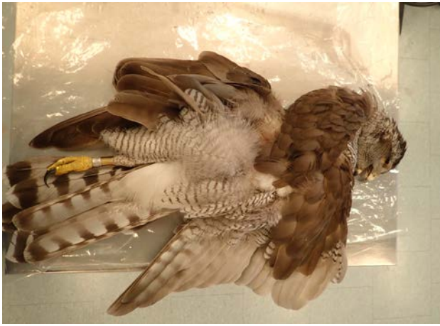
Efter tvätt och föning är fjäderdräkten återigen fluffig.