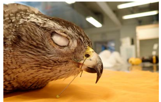
Ögonen har ersatts med bomull och tråden som stänger näbben hålls på plats med en knappål.