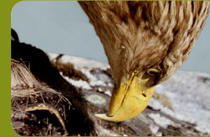
ÖRN / HAVSÖRN