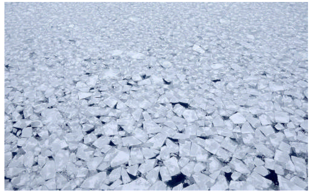
Drivisen är en perfekt jaktmark då isbjörnen letar efter sin huvudföda sälen.