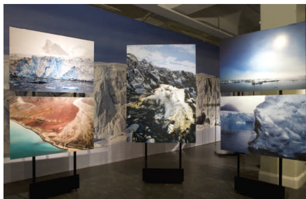
I den nya utställningen Värld av is på Naturhistoriska riksmuseet visas hur klimatförändringarna påverkar isen och livet i Arktis.