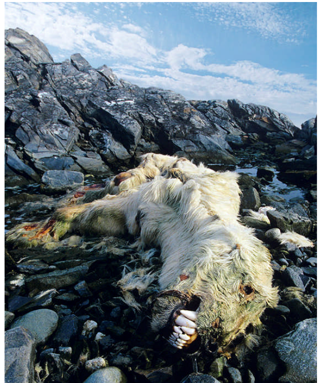
När havsisen försvinner blir isbjörnar fångar på land utan möjlighet att jaga säl. Den här tvåårs-ungen och dennes syskon dukade under av svält då isen var mer än trettio mil bort.