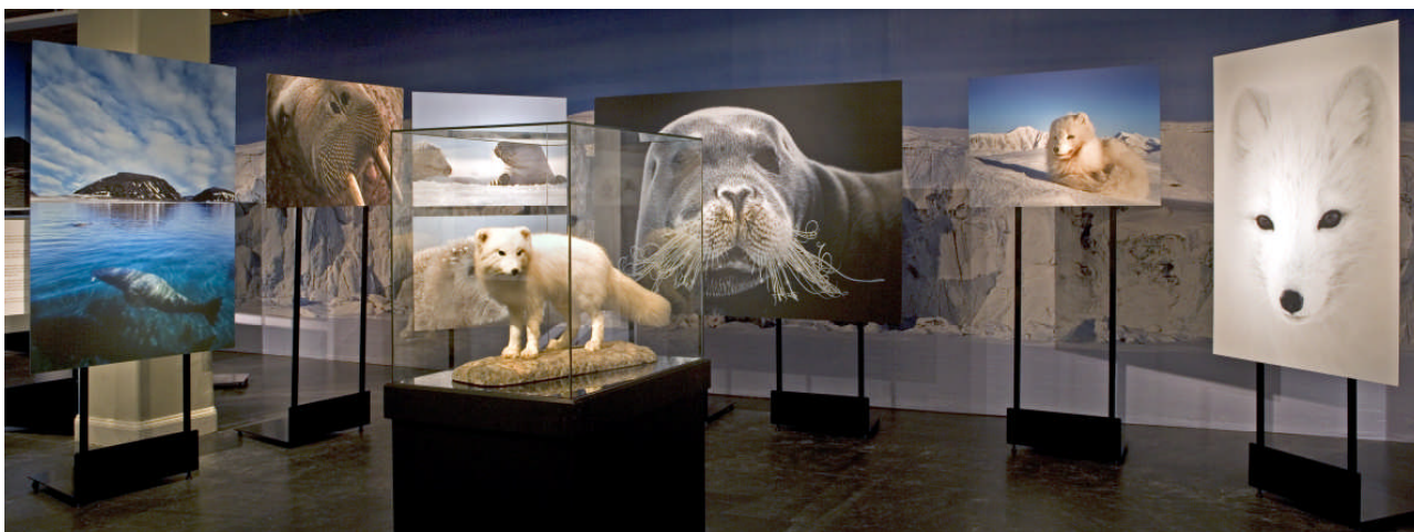
Fjällräven är en av de arktiska överlevarna och en del av den nya utställningen Värld av is på Naturhistoriska riksmuseet.