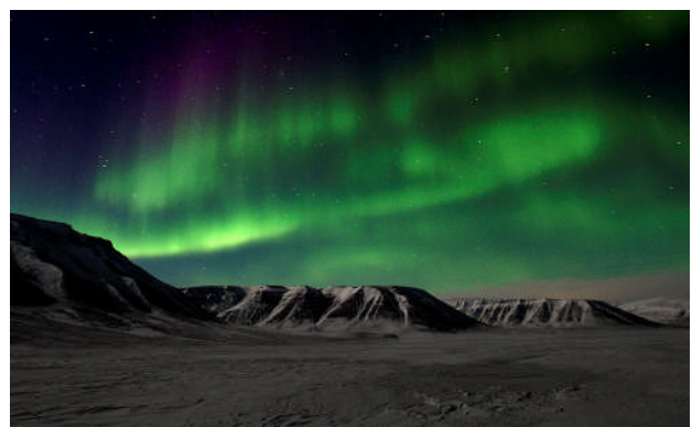
Under polarnatten färgas himlen av magiska norrsken i regnbågens färger. Fullmånens ljus gör att natt blir till dag.