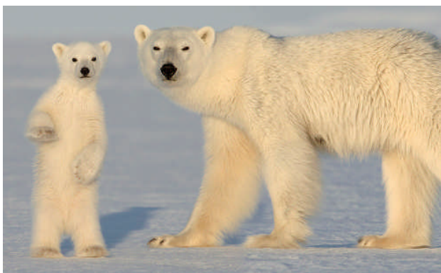
Isbjörnshona med sin unge spanar efter mat.

För publicering av fotografierna på sidan två och tre, kontakta Mireille de la Lez, mireille@vanishingworld.se, 070-727 21 00.