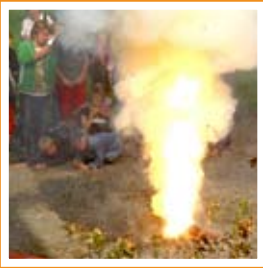
Volcano di Frescati. Foto: Martin Testorf

Naturhistoriska riksmuseet augusti 2009. Foto: Anders Rising, Martin Testorf, Staffan Wærndt, MacGillivray Freeman Films Illustration: Jonas Lundin Papper: 130 Scandia 2000 Vit Uppånga. 1000 ex Tryck: Editia