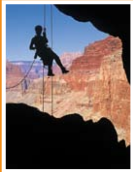
Från filmen Grottor – Jordens dolda världar .