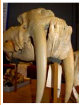
Avgjuten skalle av sabeltandad tiger.

Geologins Dag firas i hela landet och ger dig kunskap om vår jord. Från Skåne i söder till Norrbotten i norr kan du delta i aktiviteter under en dag i september varje år. Vill du veta mer? Se www.geologinsdag.nu