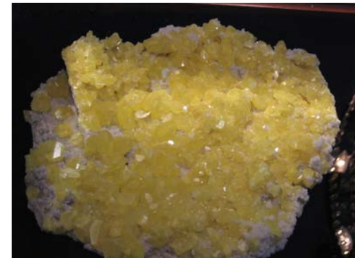
Svavel – däck, plast