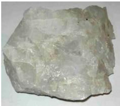
Kvarts - glas