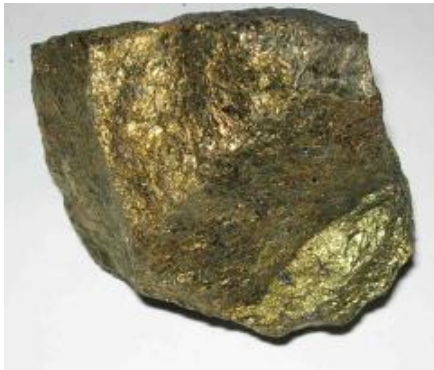
Kopparkis - elektricitet