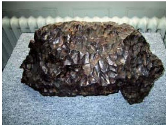
Järnmeteorit från Sibirien