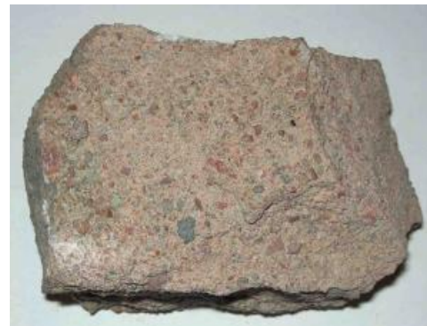
Fältspat - glas