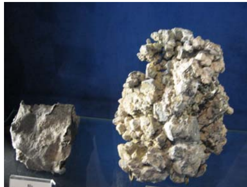
Bly - bilbatteri