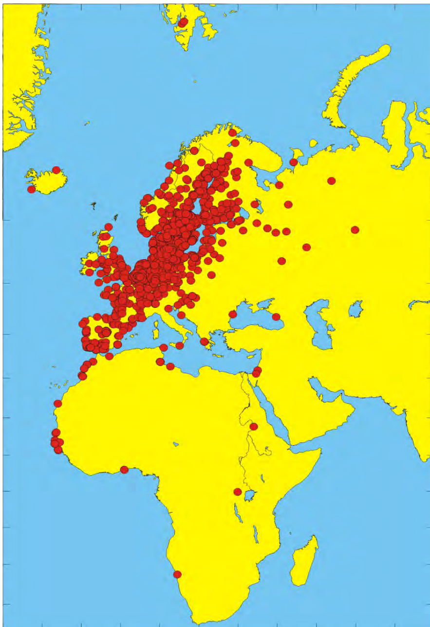
Figur 2. Platser där fåglar ringmärkta i Sverige påträffats och behandlats som återfynd under 2019.

långsiktigt studera effekter av ett mildare klimat. Det totala antalet ringmärkta fåglar i Sverige sedan ringmärkningen startade i landet 1911 uppgår efter 2019 till nästan 15,4 miljoner. Från 2009 och framåt finns samtliga märkningar i landet digitalt tillgängliga. Att antalet ringmärkta fåglar i databasen ökar mer än antalet ringmärkta under året beror på att ringmärkare dataregistrerat ringmärkningar utförda längre tillbaka och som bara funnits arkiverade som handskrivna protokoll på museet. När dessa skickats över till ringmärkningscentralen har de inkluderats i den databas över ringmärkta fåglar som nu innehåller mer än hälften av de fåglar som ringmärkts i Sverige sedan starten 1911.